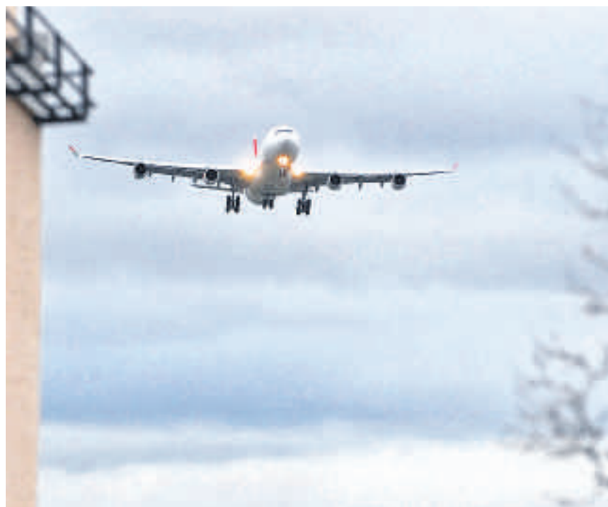
Horrorvorstellung für den Flughafen-Osten: Massiv mehr Anflüge auf die Piste 28.