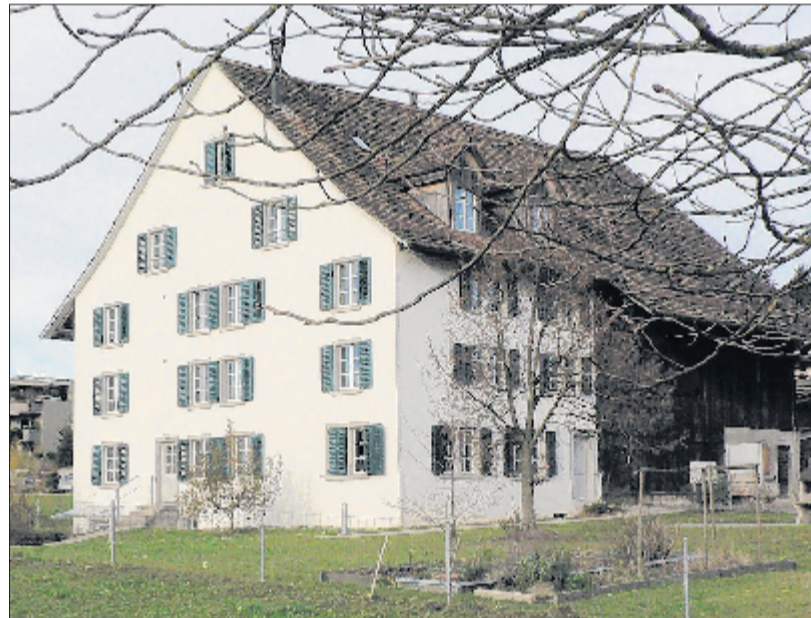
1971 von der Katholischen Kirchgemeinde erworben – und vor 15 Jahren beinahe abgebrochen: das «Haus zum Wiesenthal» in Schwerzenbach. (brü)

Der erforderliche Baukredit in Höhe von 2,2 Millionen Franken war an der Kirchgemeindeversammlung vom September 1998 bewilligt worden. (thi)