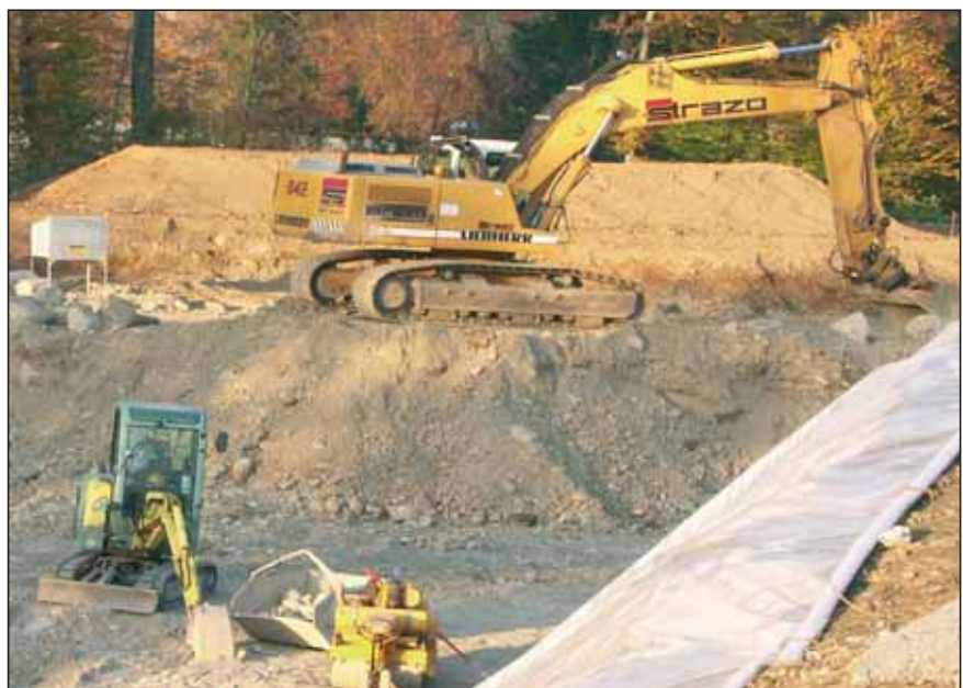
Baustelle in Bassersdorf. Nach dem Willen der Baudirektion künftig ein seltenes Bild.

schiedenen Bauverboten in Kloten meldete Mitte Juni auch die Gemeinde Bassersdorf, dass ein Bauvorhaben völlig