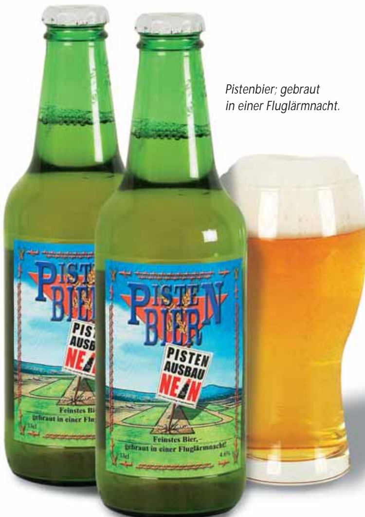
Pistenbier; gebraut in einer Fluglärmnacht.

2006, ist zugleich der Tag der dritten BFO-Mitgliederversammlung und der Einführung der neuen, instrumenten-gestützten Anflüge auf die Ost-Westpiste 10/28.